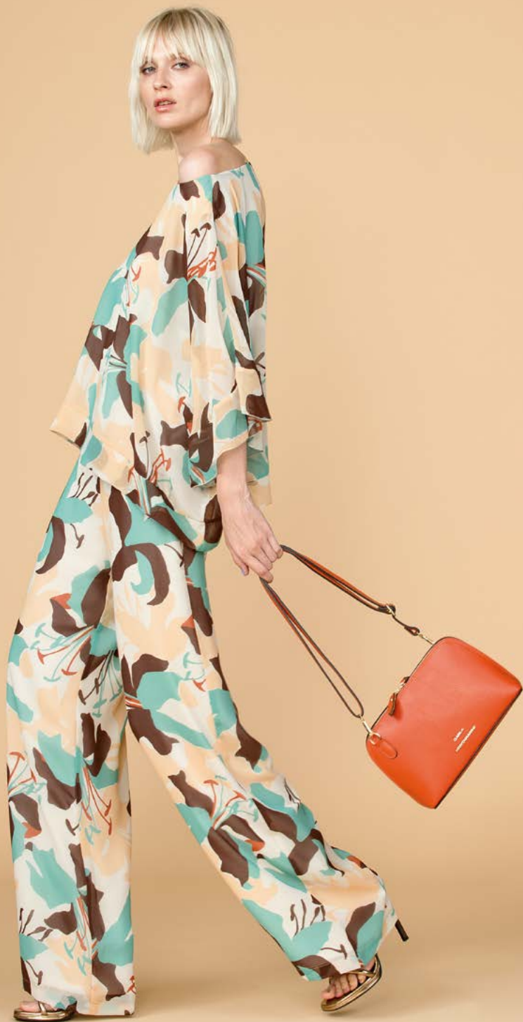
TUNICA 3146 L32 - PANTALONE 3225 L32 - BORSA 3363