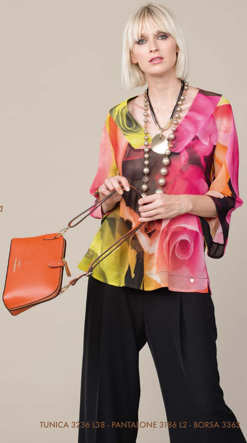
TUNICA 3236 L38 - PANTALONE 3186 L2 - BORSA 3363