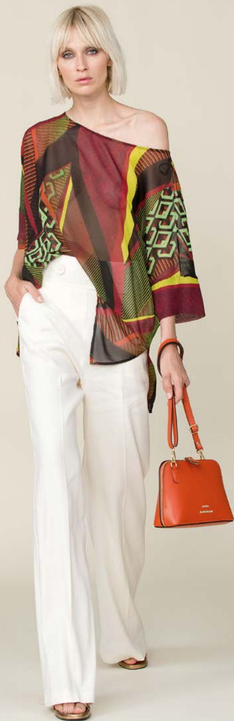
TUNICA 3296 L36 - PANTALONE 3276 L5 - BORSA 3363