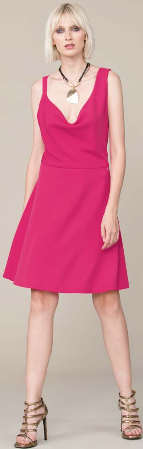
ABITO 3245 L2