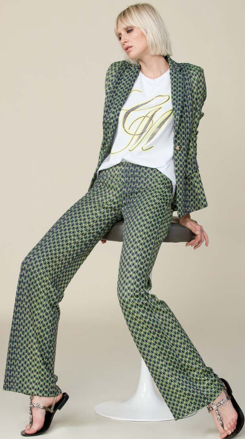
GIACCA 3117 L52 - T-SHIRT 3356 - PANTALONE 3235 L52