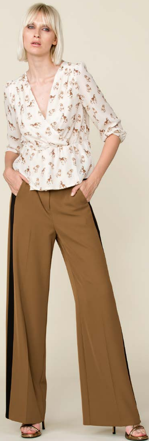
TUNICA 3168 L42 - PANTALONE 3133 L2