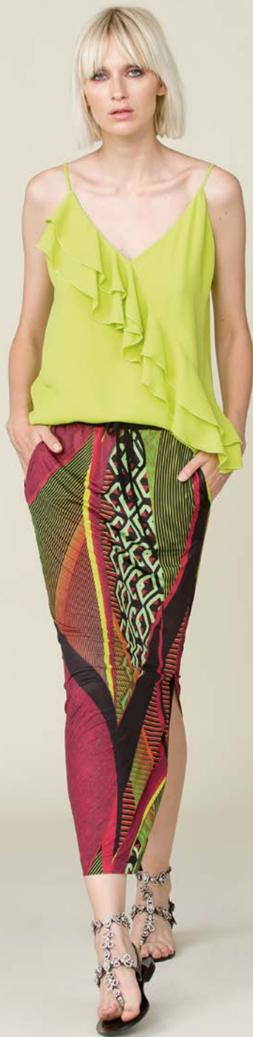
TUNICA 3286 L6 - GONNA 3258 L46