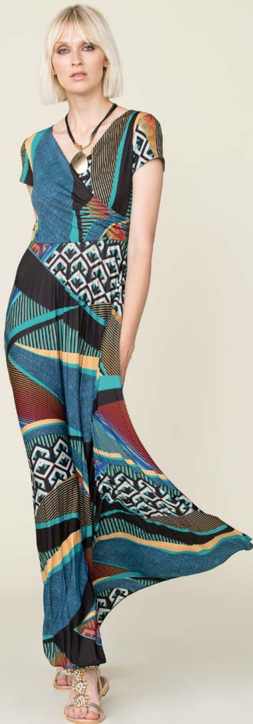
ABITO 3351 L46