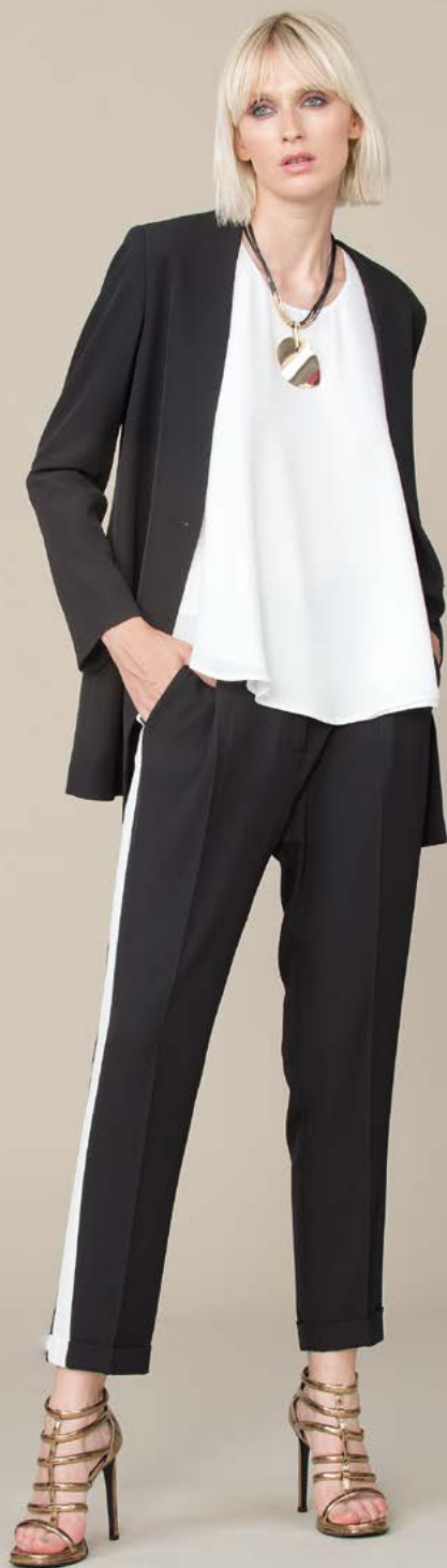
GIACCA 3111 L2 - TUNICA 3274 L6 - PANTALONE 3239 L2