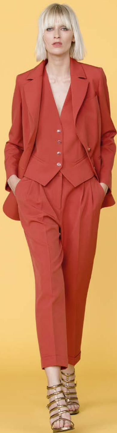
GIACCA 3113 L1 - GILET 3126 L1 - PANTALONE 3238 L1