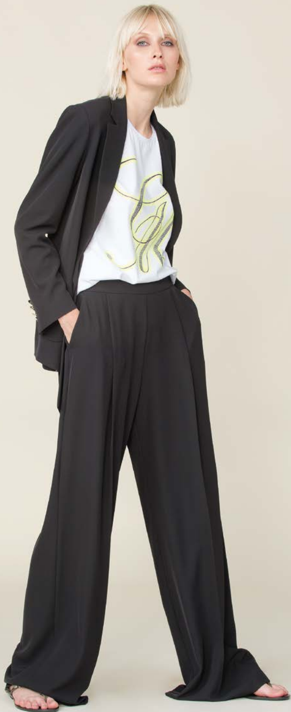
GIACCA 3108 L2 - T-SHIRT 3356 - PANTALONE 3186 L2