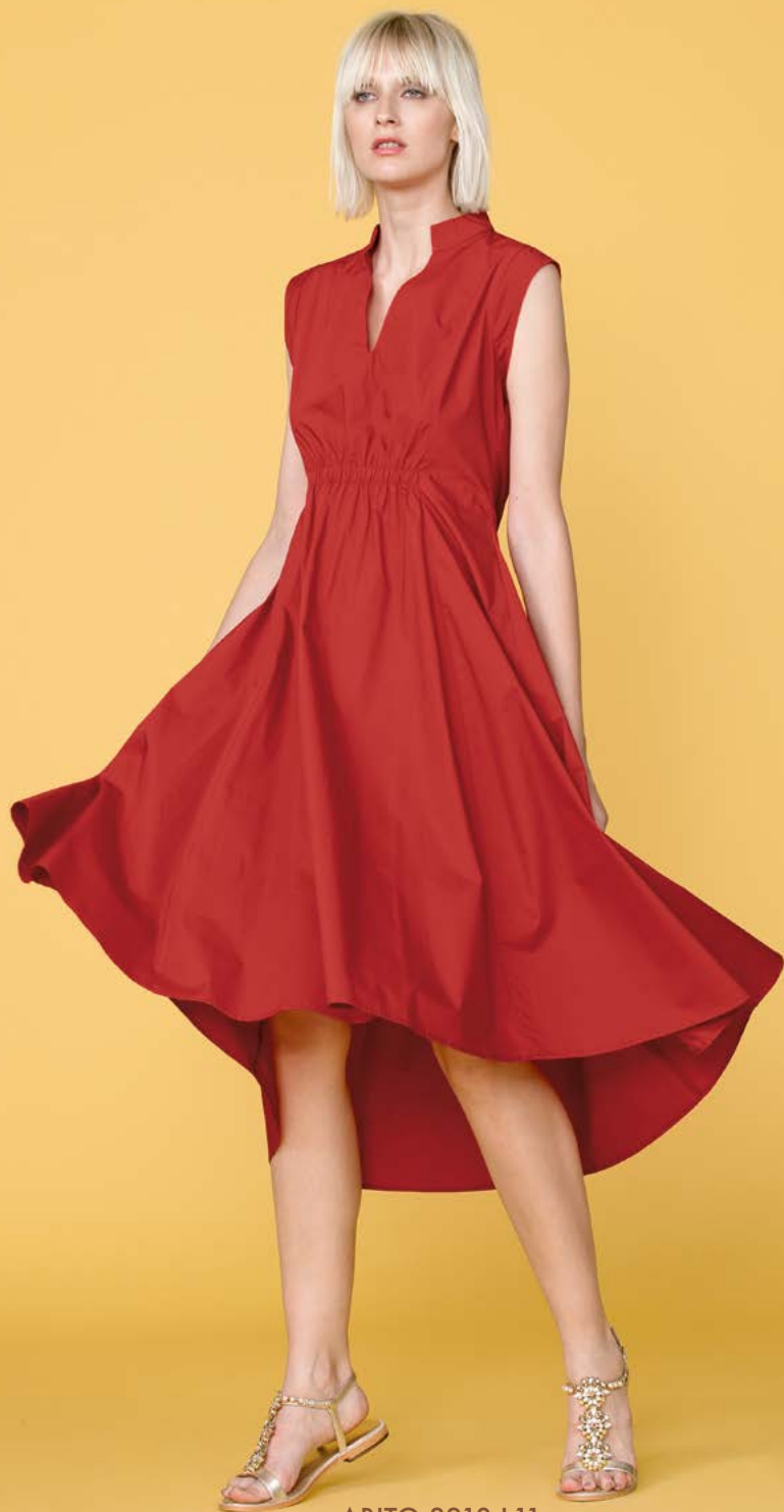
ABITO 3218 L11