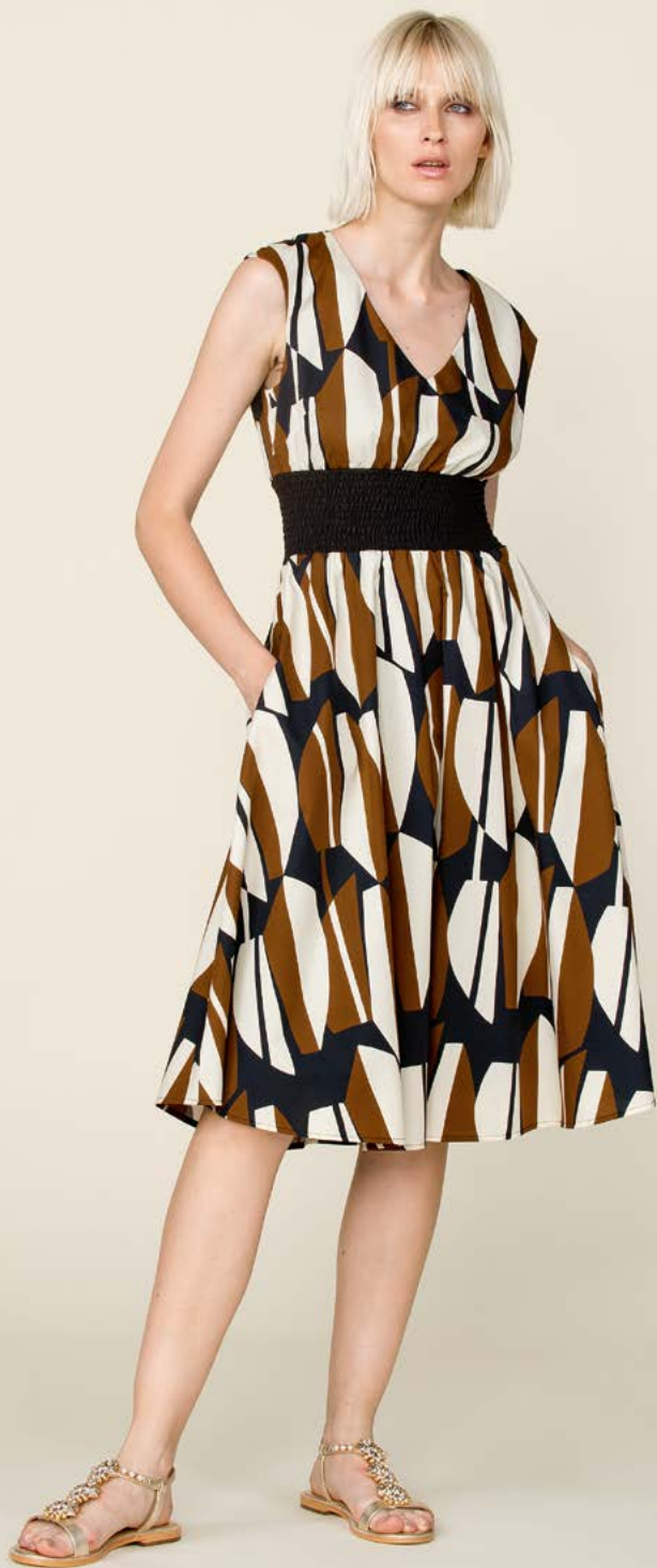
ABITO 3214 L25