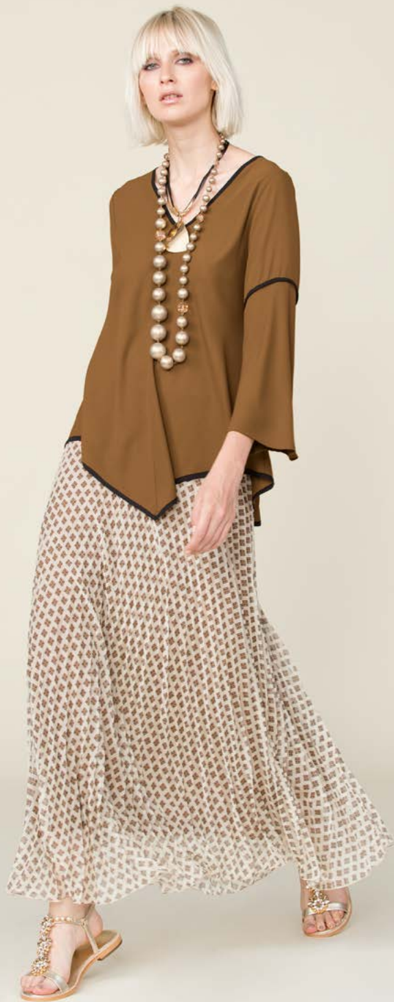
TUNICA 3136 L6 - GONNA 3193 L31