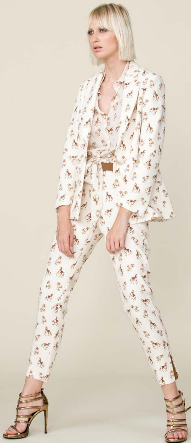
GIACCA 3103 L23 - CAMICIA 3147 L42 - PANTALONE 3226 L23