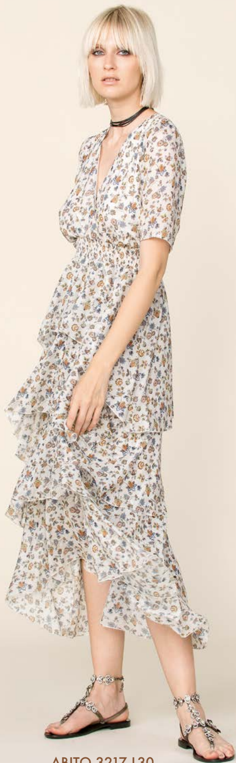
ABITO 3217 L30