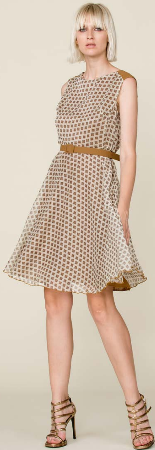
ABITO 3223 L31