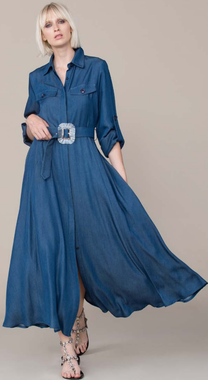
ABITO 3308 L13