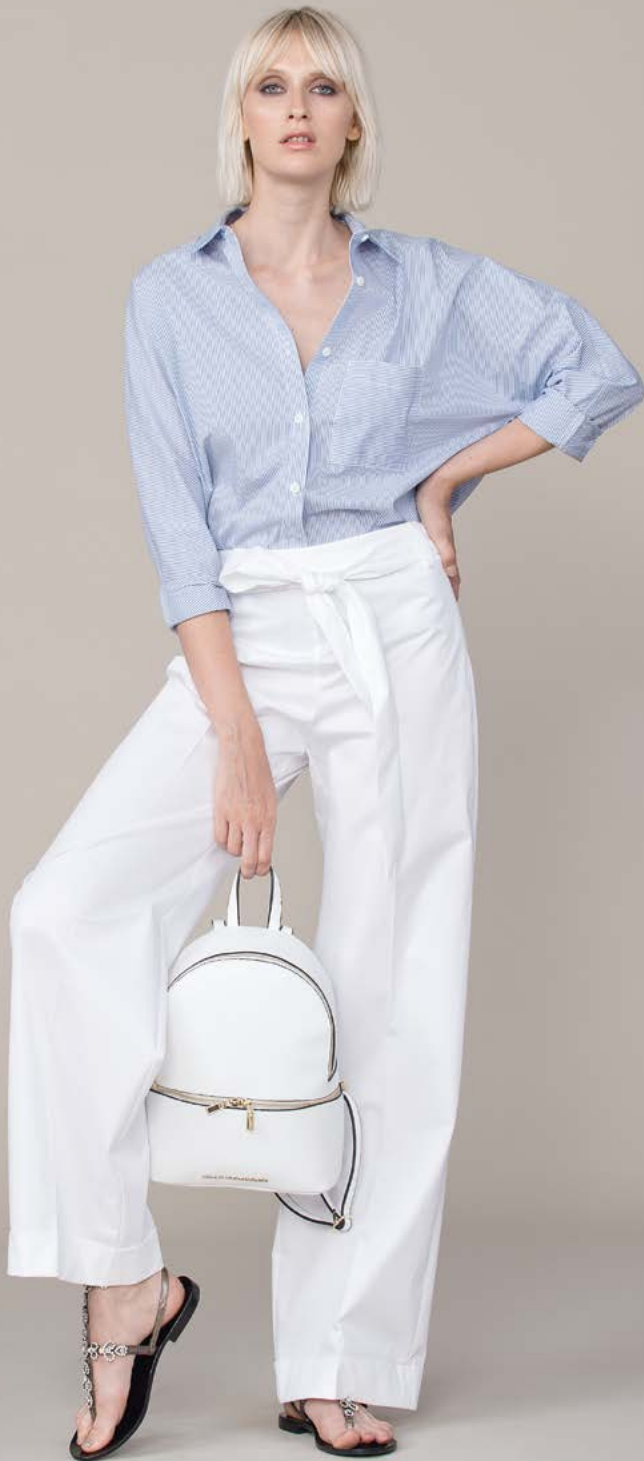
CAMICIA 3278 L19 - PANTALONE 3184 L4 - ZAINO 3364