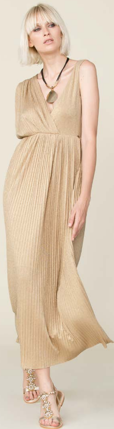
ABITO 3330 L14