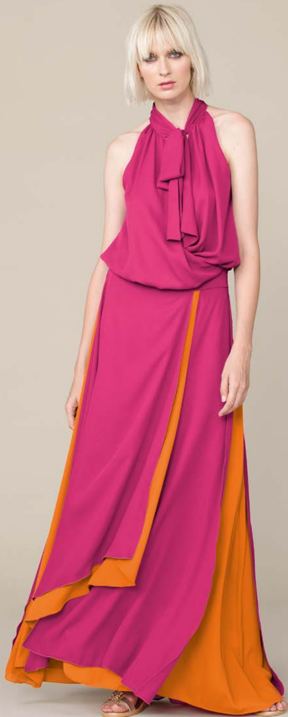
ABITO 3339 L6