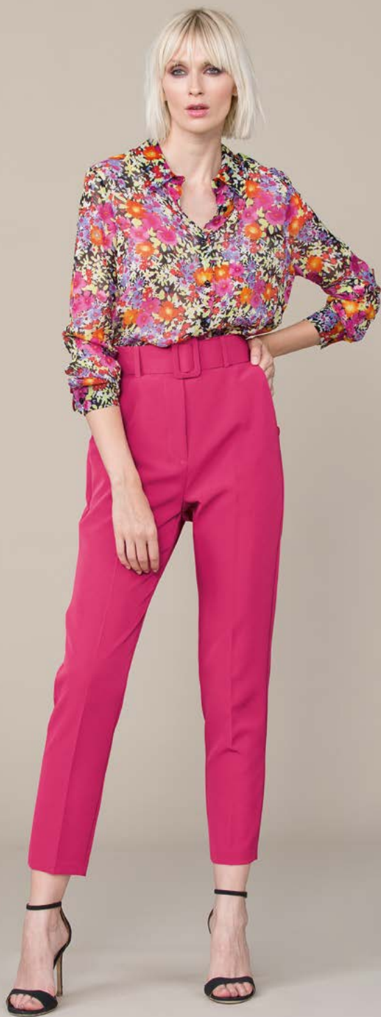
CAMICIA 3224 L29 - PANTALONE 3183 L1