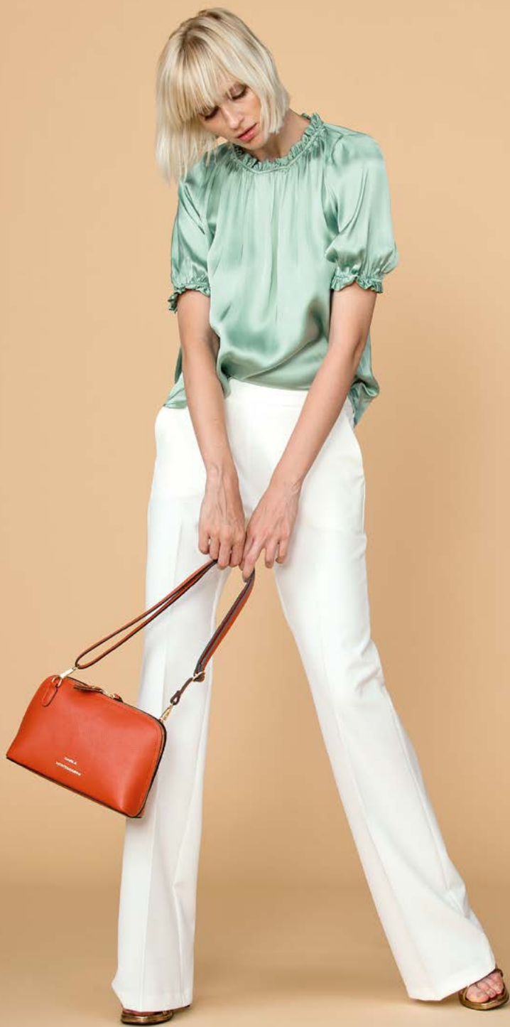
TUNICA 3170 L12 - PANTALONE 3232 L1 - BORSA 3363