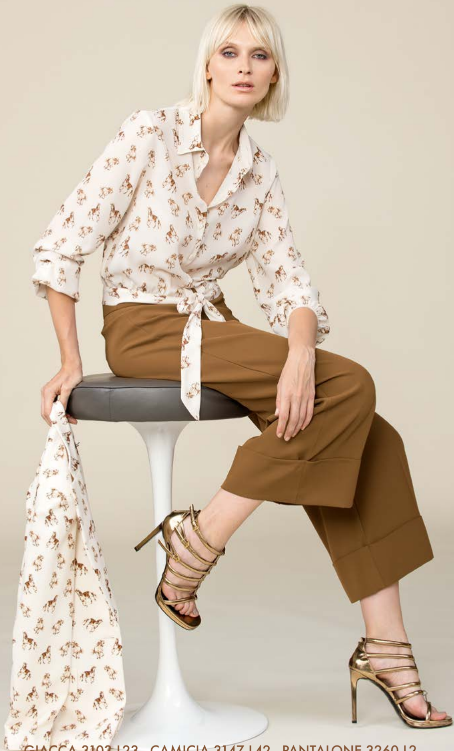
GIACCA 3103 L23 - CAMICIA 3147 L42 - PANTALONE 3260 L2