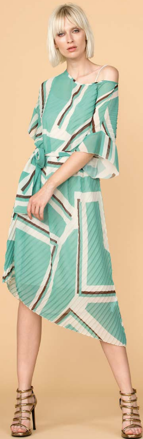
ABITO 3202 L33