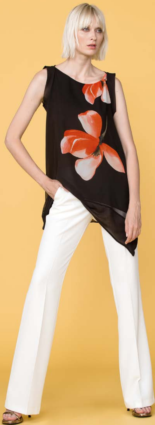
TUNICA 3262 L40 - PANTALONE 3232 L1