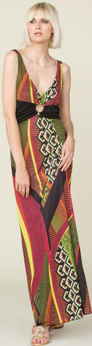
ABITO 3142 L46