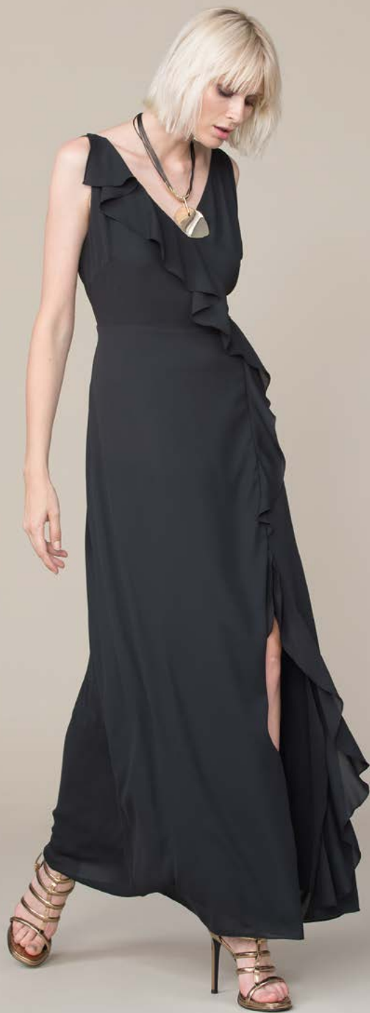
ABITO 3263 L6