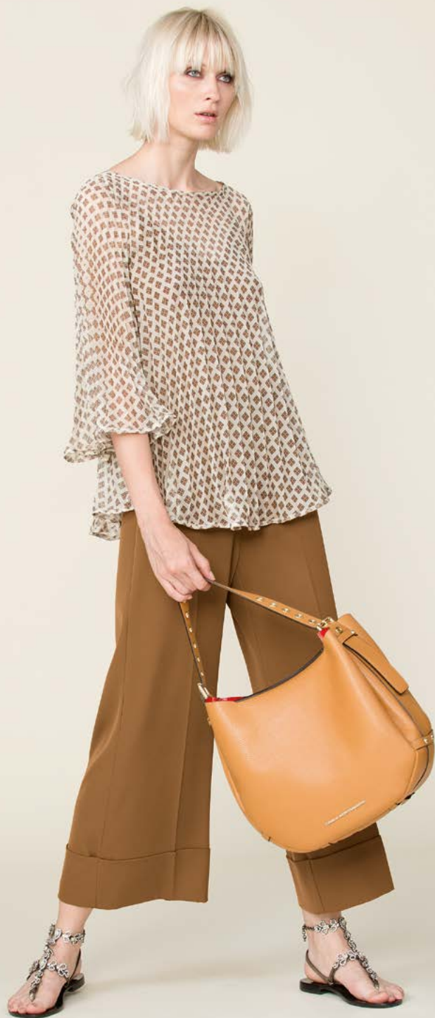
TUNICA 3194 L31 - PANTALONE 3260 L2 - BORSA 3360