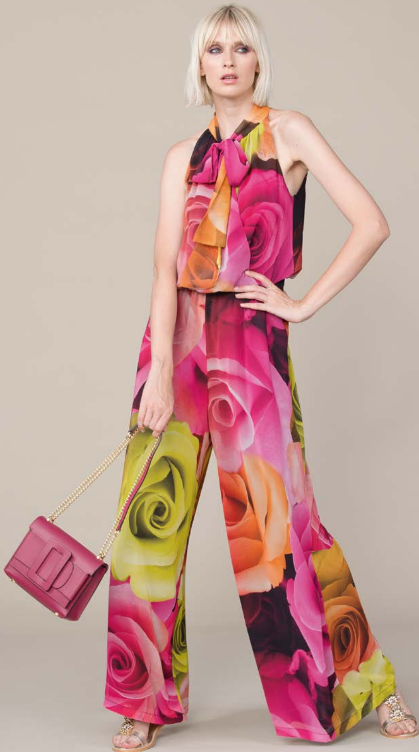
TUTA 3243 L38 - BORSA 3365