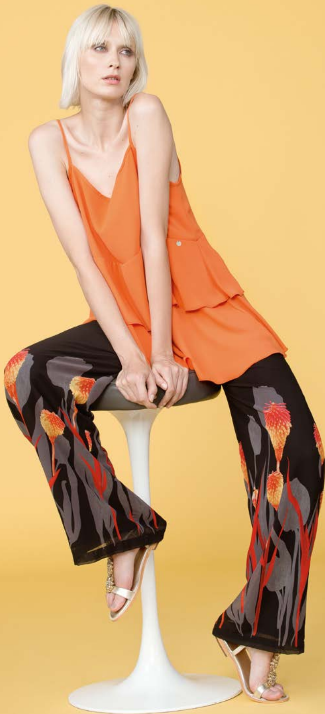
TUNICA 3287 L6 - PANTALONE 3225 L39