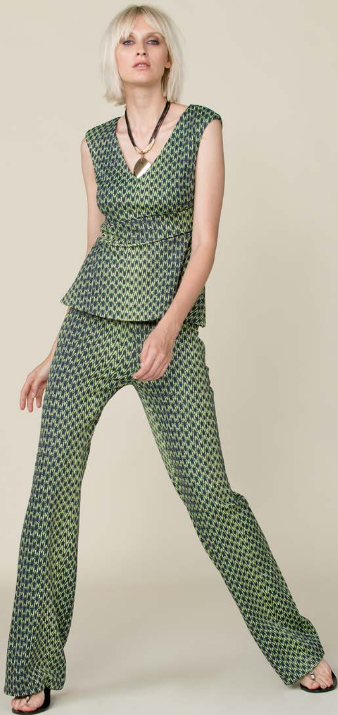
TUNICA 3266 L52 - PANTALONE 3235 L52