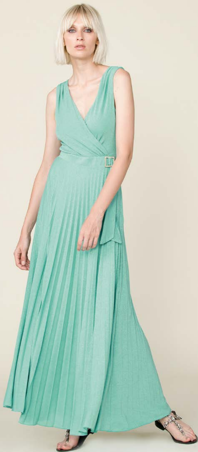
ABITO 3203 L14