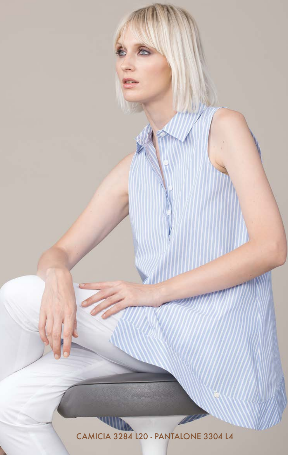
CAMICIA 3284 L20 - PANTALONE 3304 L4