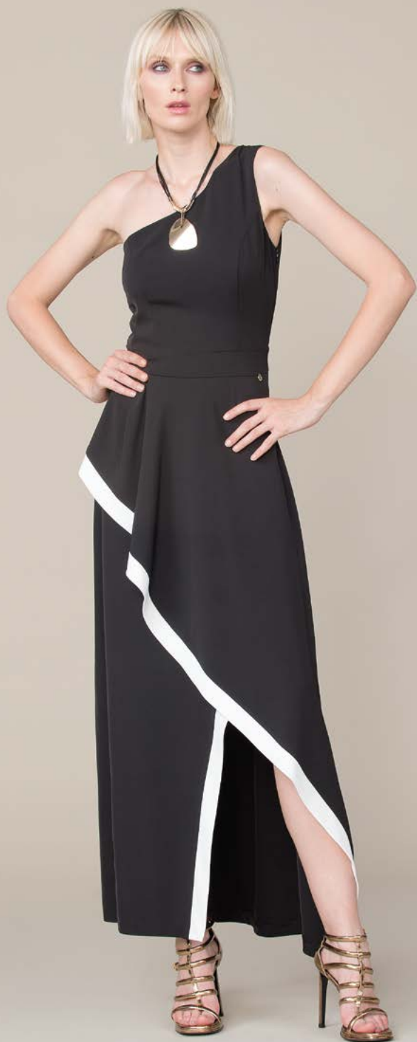
ABITO 3191 L2