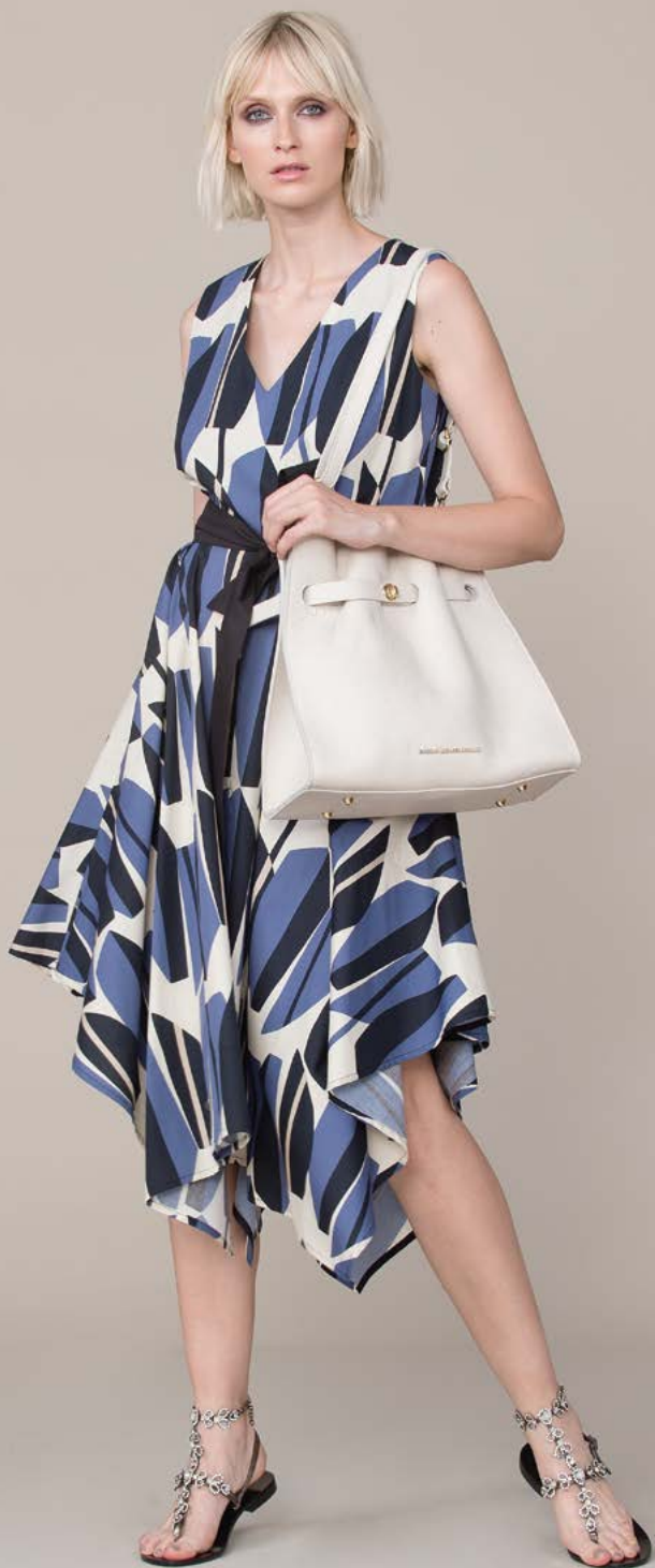
ABITO 3141 L25 - BORSA 3362