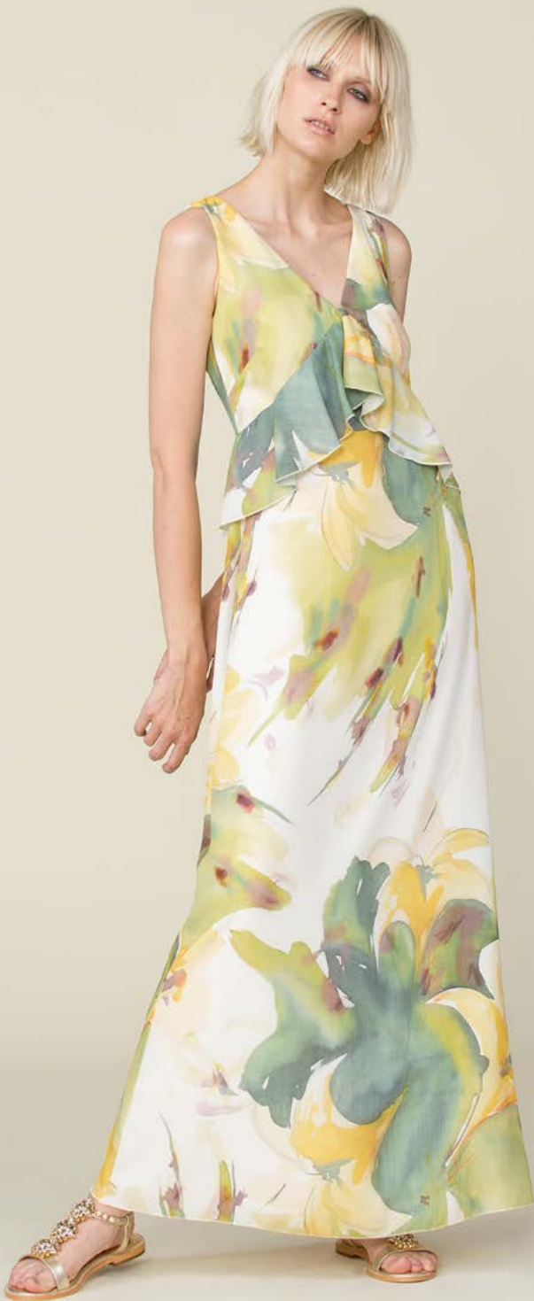
ABITO 3139 L41