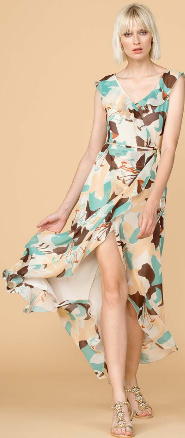
ABITO 3131 L32