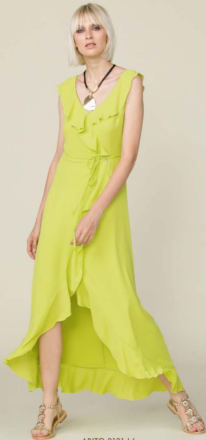
ABITO 3131 L6