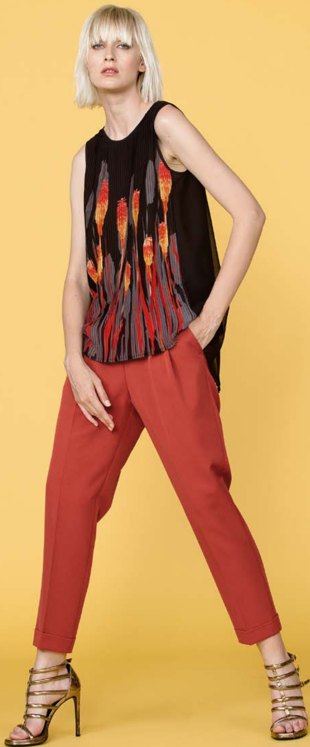
TUNICA 3285 L39 - PANTALONE 3238 L1